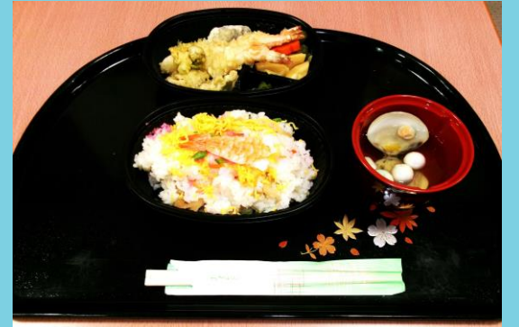
ひな祭りの献立 ちらし寿司とハマグリのお吸い物、 エビ、シイタケ、フキトウの天ぷら、 タケノコ、ふき、人参の煮物でした!!