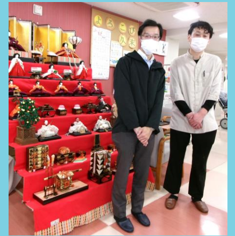
ひな祭りの食事を作ってくれた グループの栄養科スタッフです。