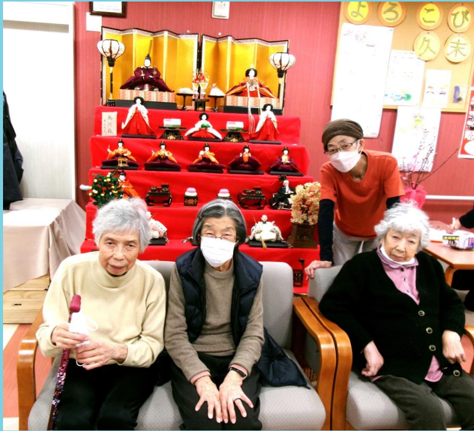
完成したお雛様を前に女性だけでパチリ♪